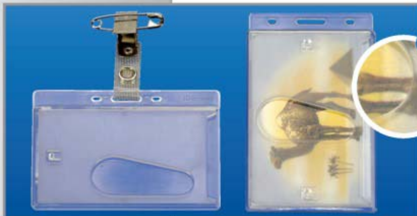
CH-21 UND CH-22

Credit card holder in front openly, plastic