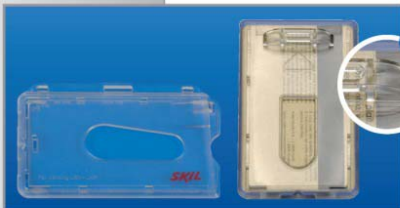
CH-11 UND CH-17

Credit card holder with notch with oblong hole, made of polystyrene